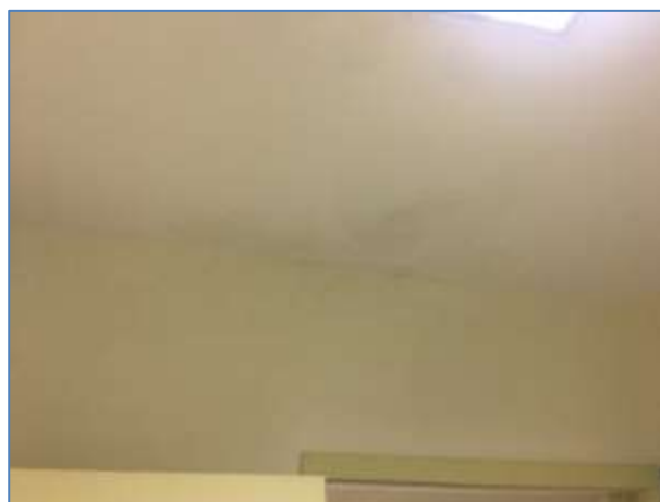
TABELA EDIF – ADEQUAÇÕES CIVIS